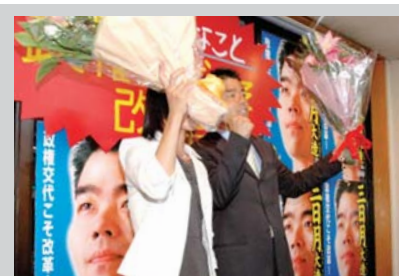
多くのご支持をうけ、2度目の当選。気持ちを新たに!

8月8日解散、9月11日の総選挙は、「郵政民営化」という改革の是非を問う選挙だったと言われています。しかし、その中身はきちんと語られず、「改革」という言葉や「民営化」というものの、イメージだけが先行し、「造反」「刺客」などの政治茶番劇だけが注目される選挙となってしまいました。