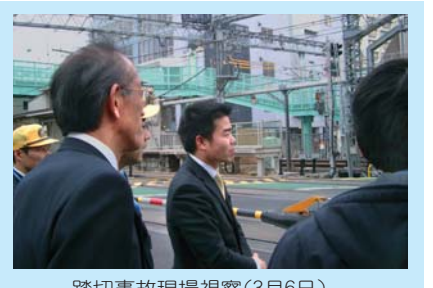
踏切事故現場視察(3月6日)